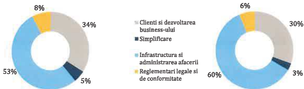
Medie ultimii 3 ani